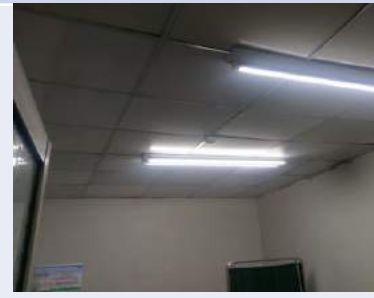
天花板會掉灰塵且有損毀情形