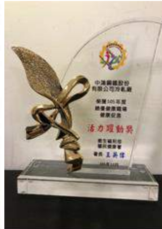
榮獲衛生福利部國民健康署績優健康職場健康促進「活力運動獎」