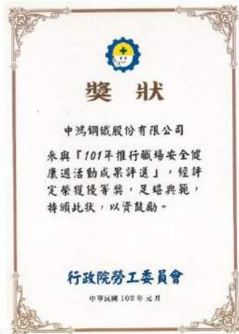
榮獲推動職場安全健康週活動-「優等獎」