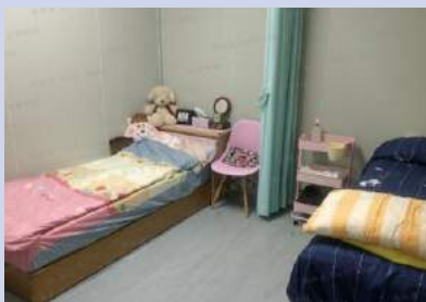
休息室兼按摩室(按摩師駐廠用)