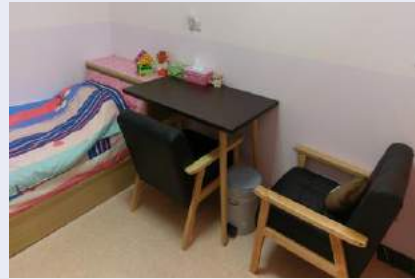
新增桌/沙發/置物櫃及圍簾提供母性同仁更為隱私的空間