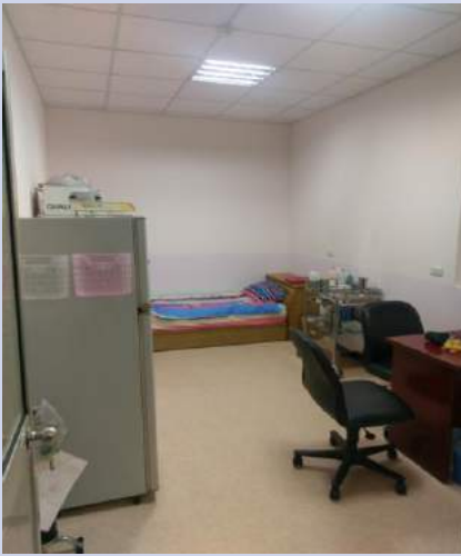
地板/天花板/牆壁更新