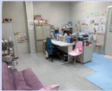
諮詢室(靠牆處職護座位)