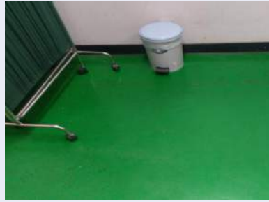
地板綠色有煙灰痕跡