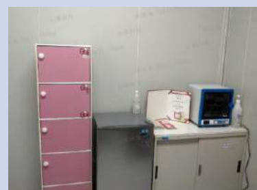
置物櫃/消毒鍋/奶瓶清潔劑使用