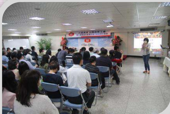
健康促進課程－養肌防老、健康瘦好