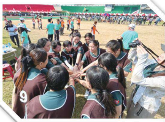
健康促進活動－運動會