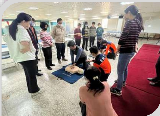
健康促進活動－基本救命術