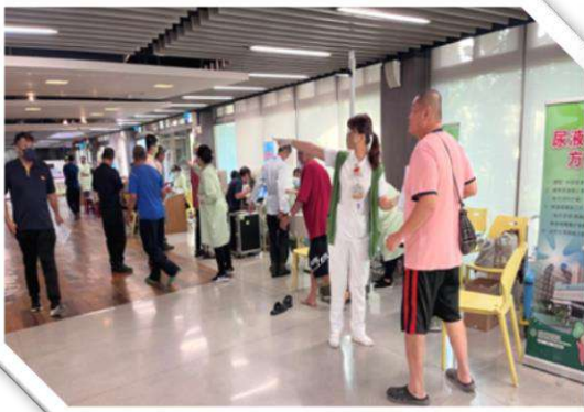
健康促進活動－年度健檢

最後，個人將持續成長提昇，讓公司整體健康管理制具備與時俱進並傳承公司永續經營的理念，從對大環境的保護到每個家庭的照顧到每位同仁關懷，可一步一腳印深植人心，達到友善職場環境、幸福企業的目標。✿