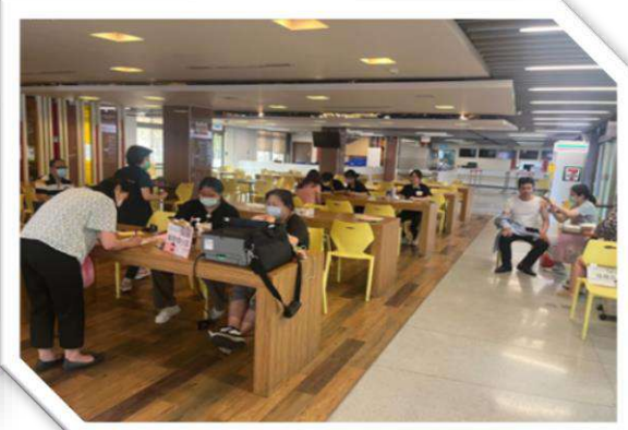
健康促進活動－疫苗接種