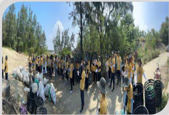
健康促進活動－淨灘日